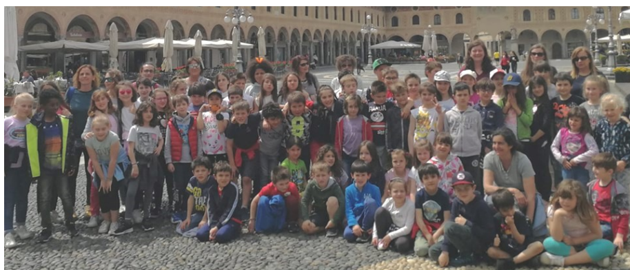
Eccoci tutti alunni ed insegnanti in piazza Ducale